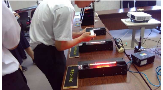
実習「プラズマと光」の様子