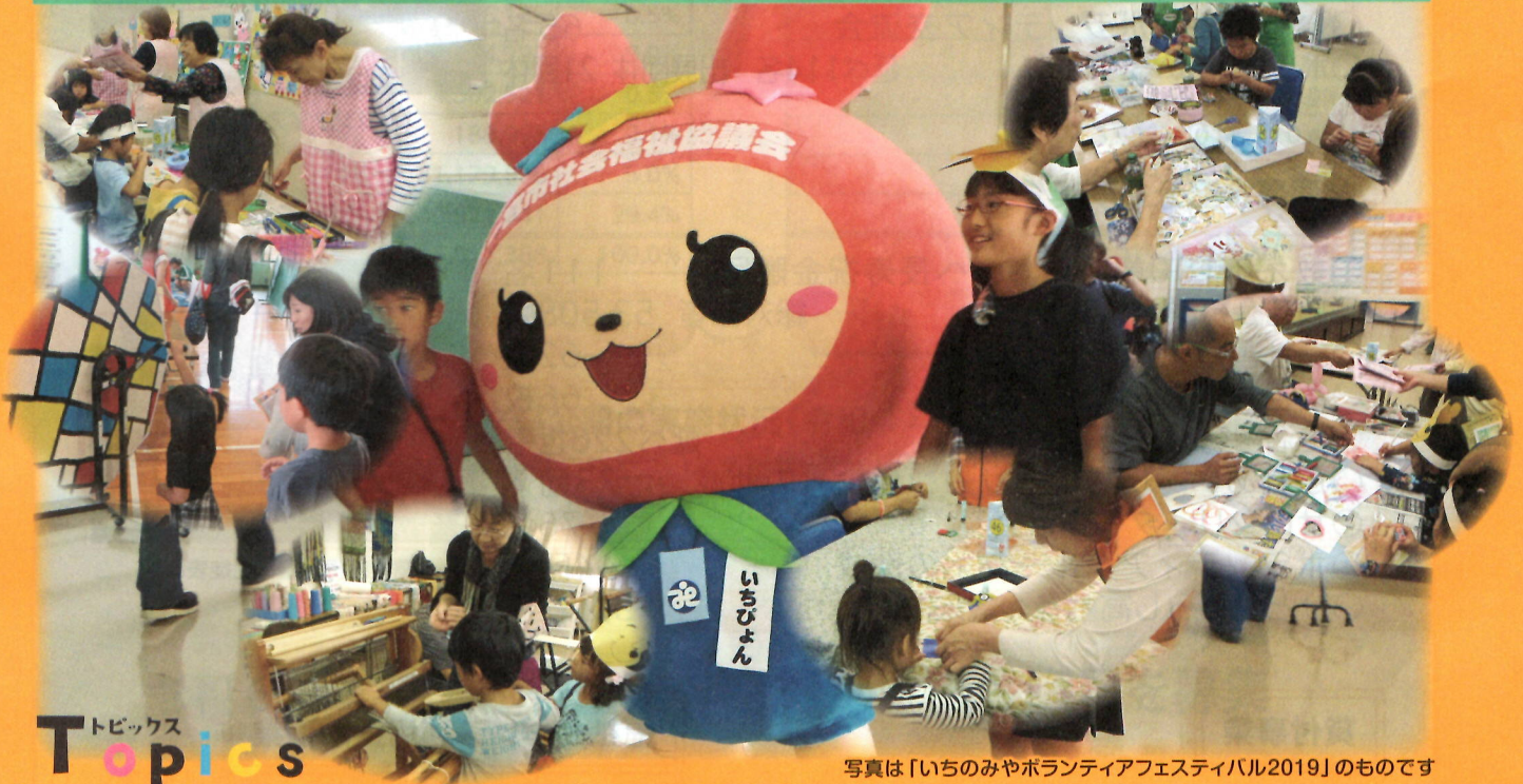
写真は「いちのみやボランティアフェスティバル2019」のものです