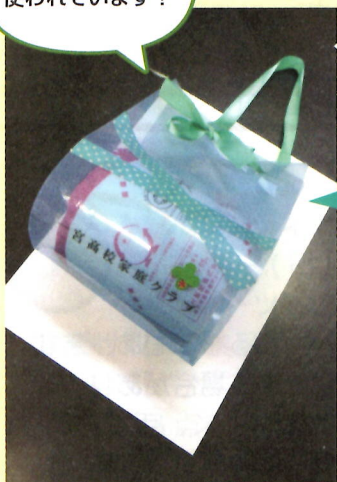
手作りの トイレトーパーホルダー