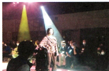
「THE尾州」での 展示・ファッションショーへの参加