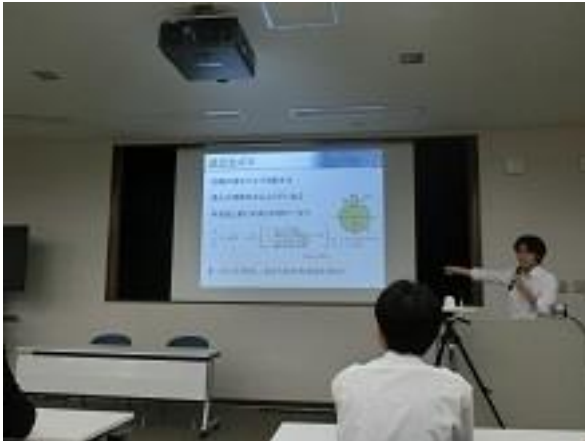
逆立ちコマ班の口頭発表の様子

核融合科学研究所の所員の方による審査の結果、火起こし班の「回転摩擦式発火法における材質と発火までの時間の関係」が優秀賞を受賞することができました。