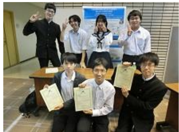
表彰式後の集合写真