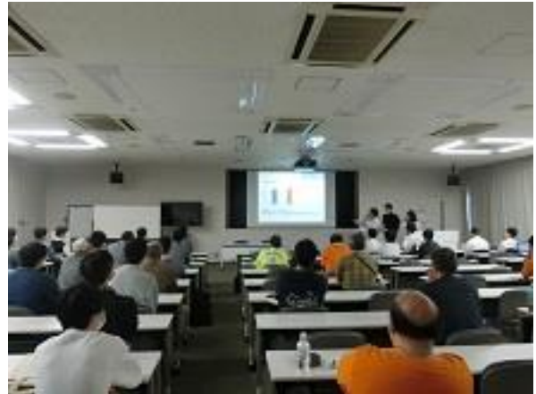
メイラード班の口頭発表の様子